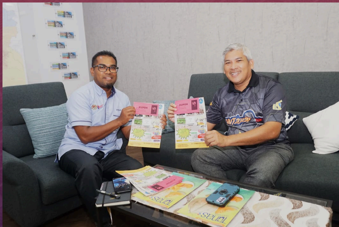
31/10 - 01/11/2023 Promosi MyTayar, Unit Pembiayaan dan Unit Keanggotaan Koperasi Pegawai-Pegawai Kerajaan Negeri Kedah Darul Aman Berhad. Bertempat Di Wisma Persekutuan Anak Bukit.